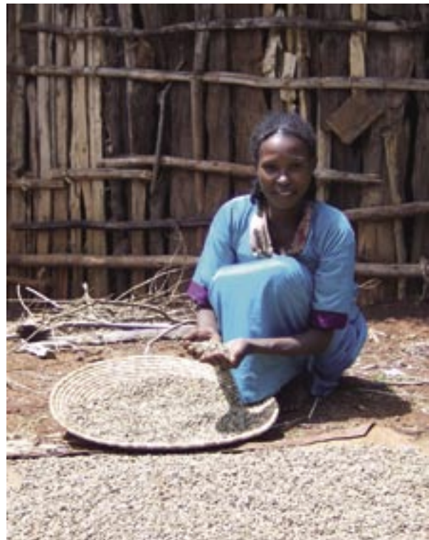
Sortiranje kave u zadržnoj udruzi Oromia, Etiopija

Dok čekate da se to dogodi, postanite i vi odgovoran kupac i provjerite gdje ustvari odlazi vaš novac. A kada vam netko sljedeći put kaže da «život nije fair» nemojte se utopiti u konformizmu, već zaplivajte protiv struje i dokažite suprotno.