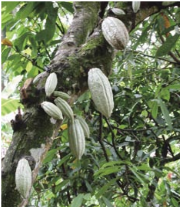
Ove mahune kakovca bit će spremne za žetvu kad postanu tamno crvene ili jarko žute

Dojučerašnje ruralno stanovništvo, migrirajući u gradove ili se nastanjujući pored industrijskih zdanja, postaje ovisno o novcu umjesto o radu na zemlji, kao do tada. A novac se može steći radom (međutim, nezaposlenost zna doseći i do 90%, a radni uvjeti su obično nezdravi i opasni) ili kriminalom (najčešće), odnosno lokalnim ratovima kakvima, primjerice, obiluje Afrika. Začarani krug je teško razbiti jer su najveći dobavljači i trgovci oružja zemlje koje su stalne članice Vijeća sigurnosti UN-a. Hm, hm. Prema velikom broju stručnjaka, uključujući bivšeg glavnog ekonomista Svjetske banke Josepha Stiglitz, tijekom 1990-tih ulaga-