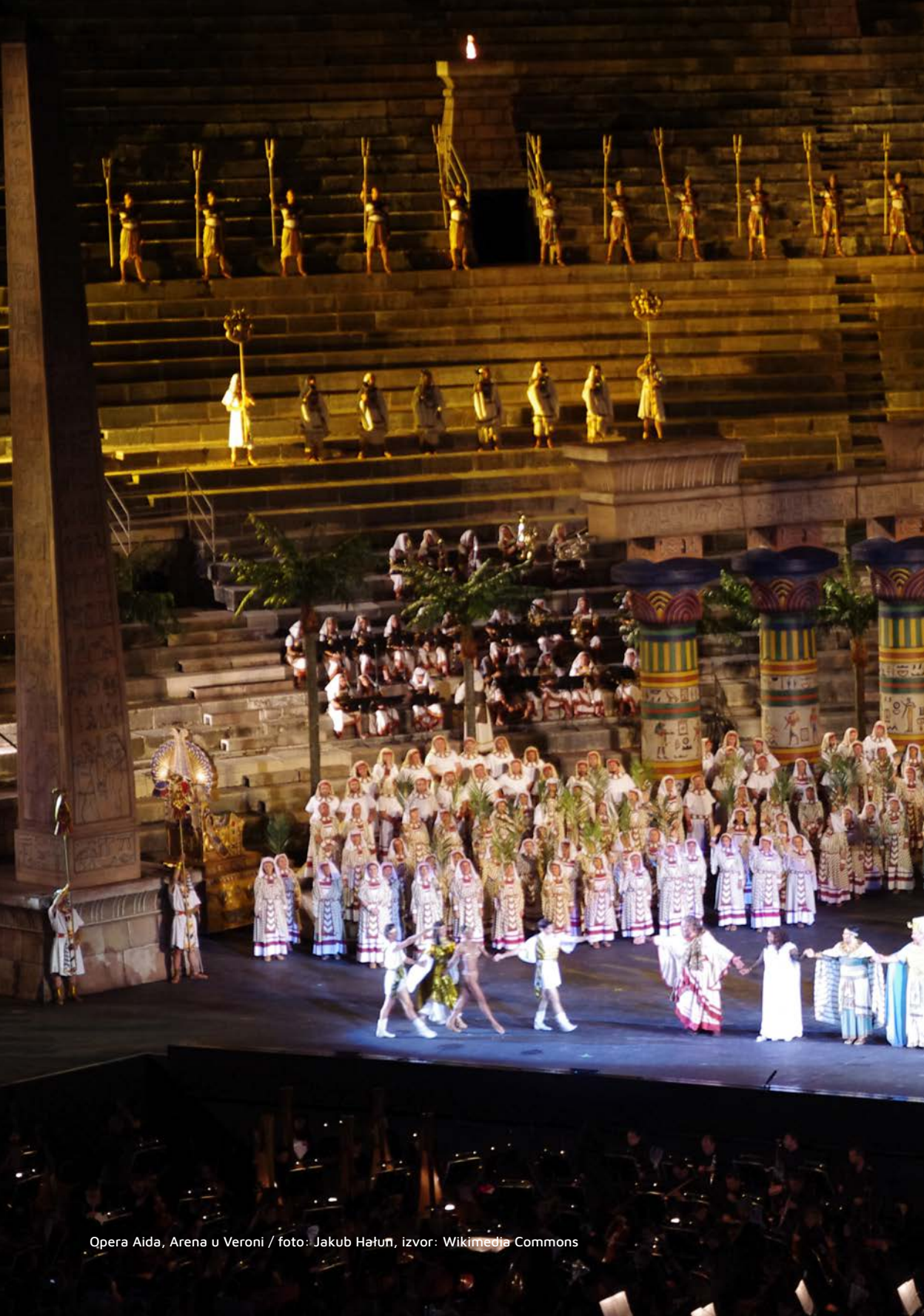
Opera Aida, Arena u Veroni