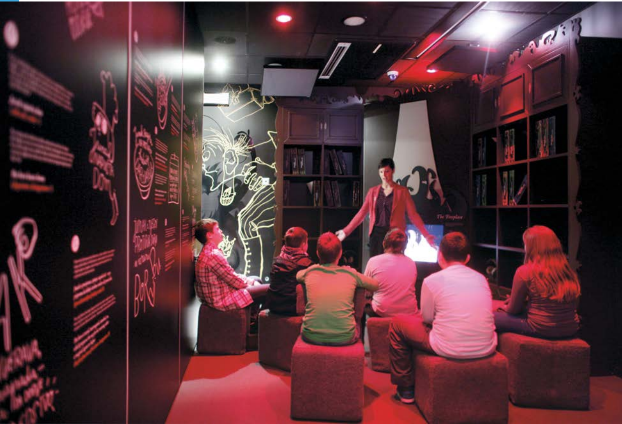
Ogulin, kuća bajki