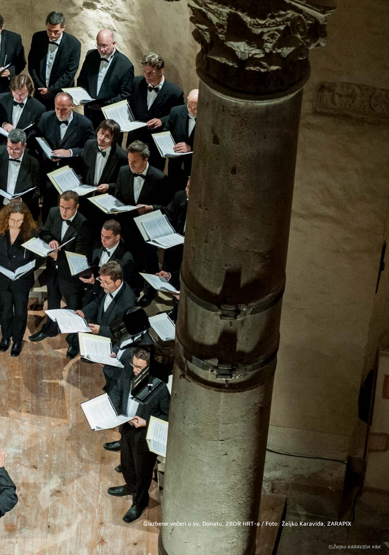
Glazbene večeri u sv. Donatu, ZBOR HRT-a