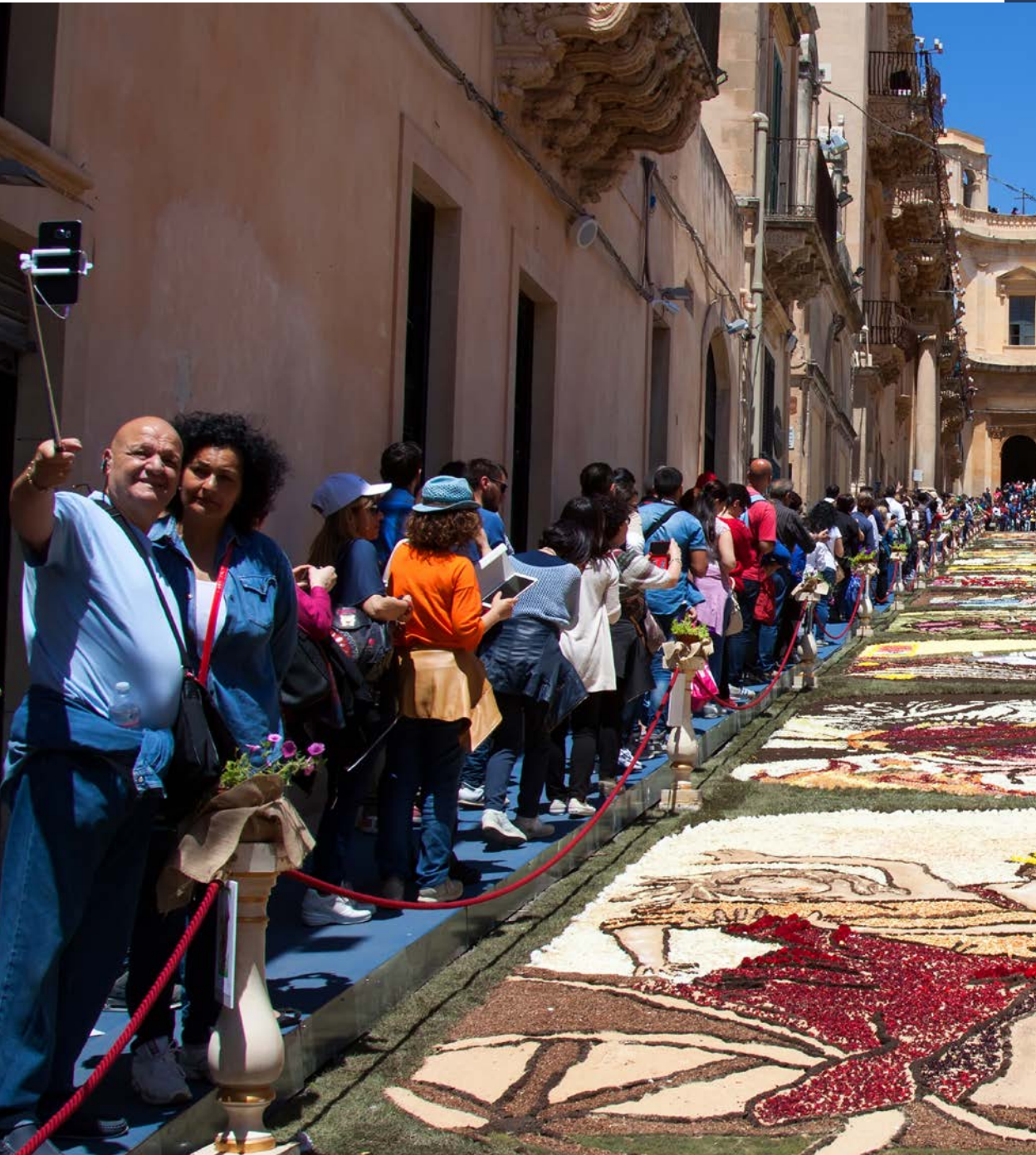
Cvjetni festival, Noto, Sicilija, Italija, foto: maratr / Shutterstock.com