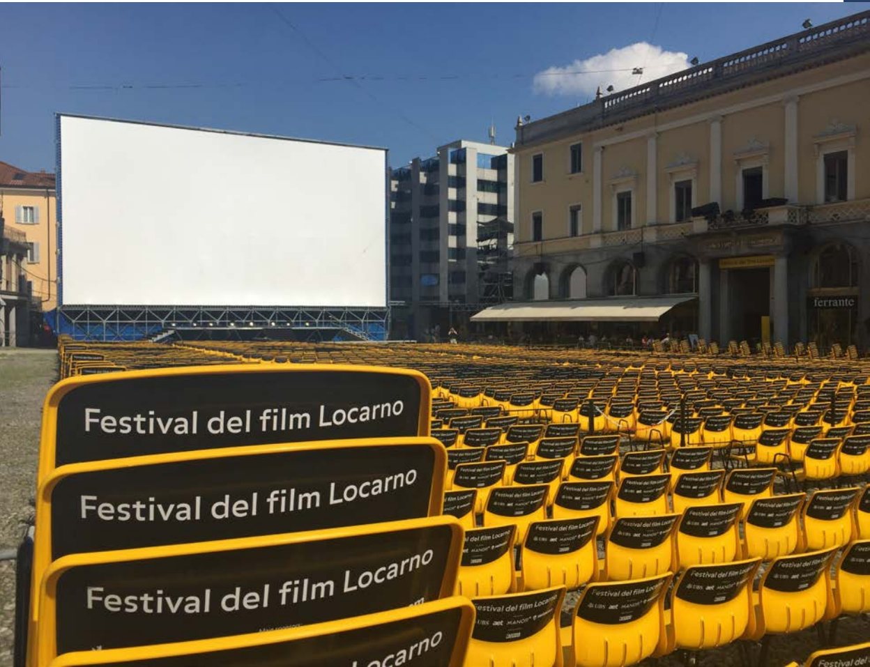
Film Festival Locarno