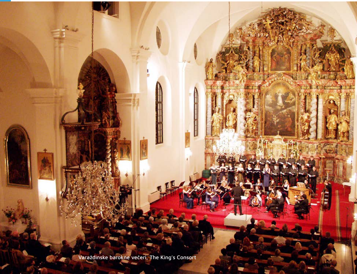
Varaždinske barokne večeri, The King's Consort

Osim glazbenika, barokom se bave i restorani i hoteli koji na jelovnicima nude barokna jela varaždinskoga kraja i vrhunska vina ovoga podneblja. Potpuni doživljaj osiguravaju galerije koje otvaraju prigodne izložbe djela likovne baštine i suvremene umjetnosti, ali i događaji u Starom gradu gdje se održavaju večeri barokne poezije i predstavljaju knjige o glazbi i glazbenicima.