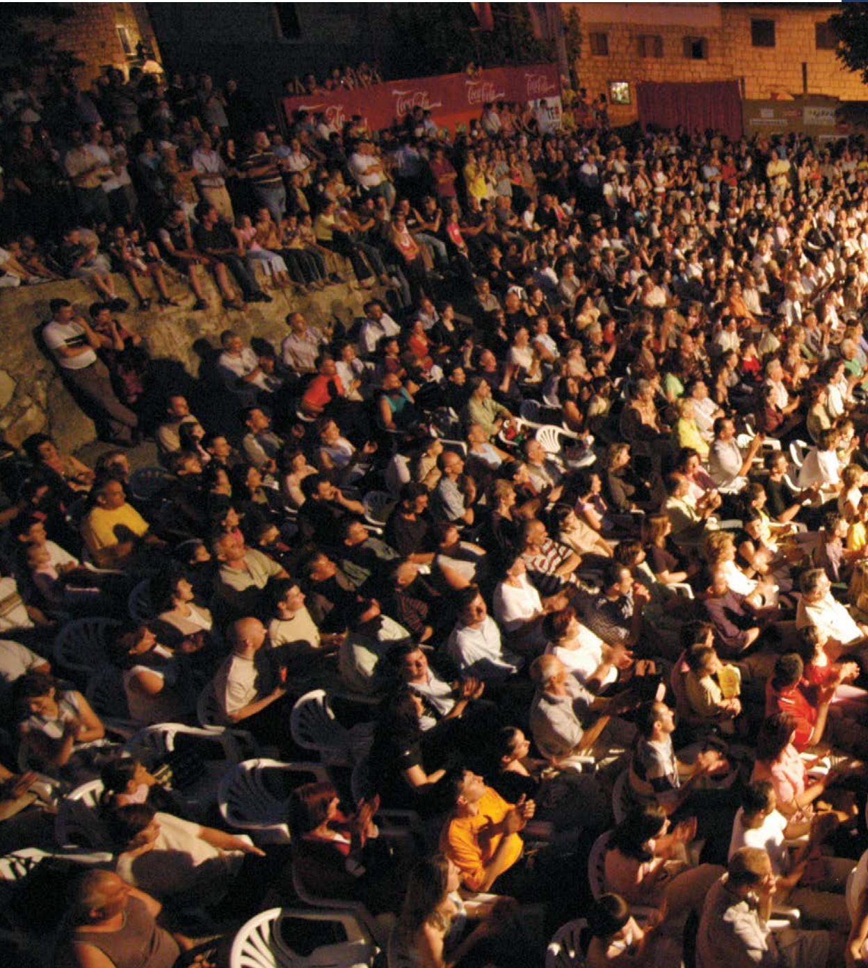
Detalj s predstave, Zagvozd