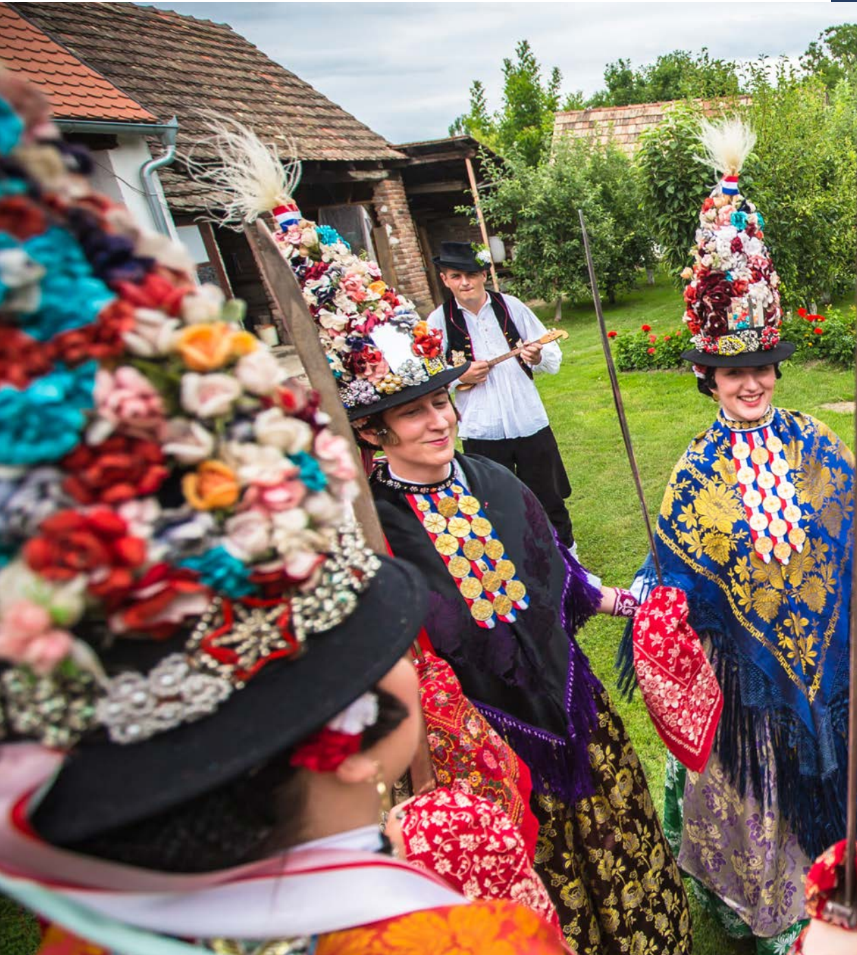
Godišnji proljetni ophod kraljice ili Ljelje iz Gorjana