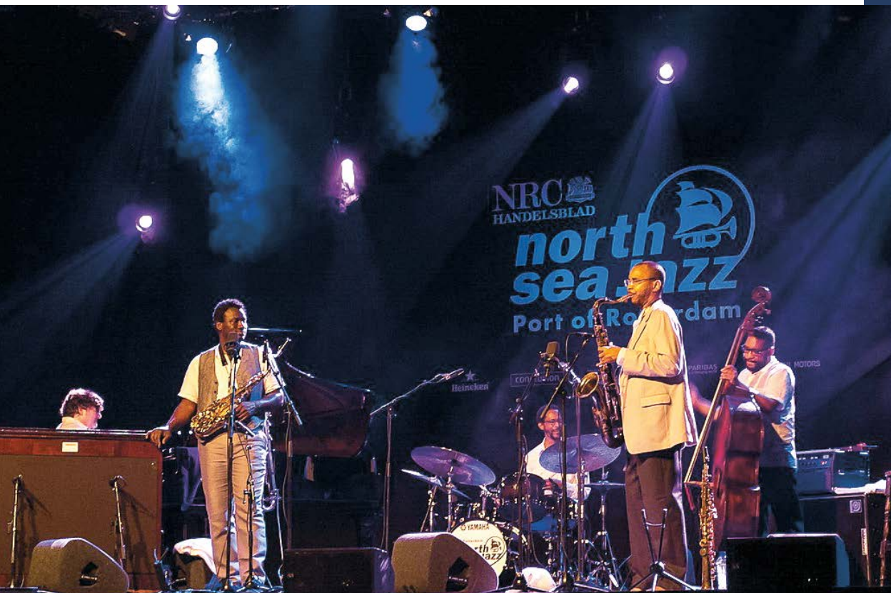
Brian Blade & the Fellowship Band, North Sea Jazz Festival 2015

i 70.000. North Sea Jazz Festival tako je postao jedan od najpoznatijih i najvećih glazbenih festivala na svijetu koji je podjednako otvoren za sve vrste jaza, ali i glazbe koja se na jazz oslanja, kao što su blues, soul, funk, hip hop, world music i druge. Unazad nekoliko godina, festival je osmislio i program za djecu North Sea Jazz Kids koji tijekom jednog dana ugošćuje najmlađu publiku na raznovrsnim glazbenim i plesnim radionicama.