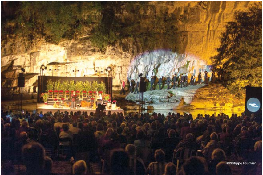
Labeaume en Musiques

Pitoreskno mjesto na jugu Francuske uz rijeku Beaume, nudi fantastičan krajolik, bogatu povijest – i festival tradicionalne glazbe. Običaj je tematski predstaviti neku zemlju, a ovdje navodimo primjer koji je indikativan i za Hrvatsku. Pod imenom Le Bal Rital - Musiques et danses d'Italie du Sud , odnosno Ritualni ples – glazba i plesovi južne Italije , u Labeaumeu su predstavljeni svirači, plesači, pjevači, marionete, kulinarstvo i zabavne igre koje se igraju u gradovima i mjestima diljem južne Italije. Nasuprot visokoj kulturi Venecije ili Firence, ovdje se ističu urbane i ruralne prakse koje su cvale kroz povijest, a žive još i danas. „La Fanfara pilosa“ naziv je zabave u kojoj sudjeluju lutke, plesači, pjevači, trublje, flaute, harmonika, kitara, gitara, udaraljke itd. Nakon izvedbe slijedi škola tradicionalnog plesa tarantela te kušanje kalabreških specijaliteta. U cijelom projektu sudjelovalo je 6 talijanskih umjetnika te dvojica kuhara, što projekt čini financijski i organizacijski