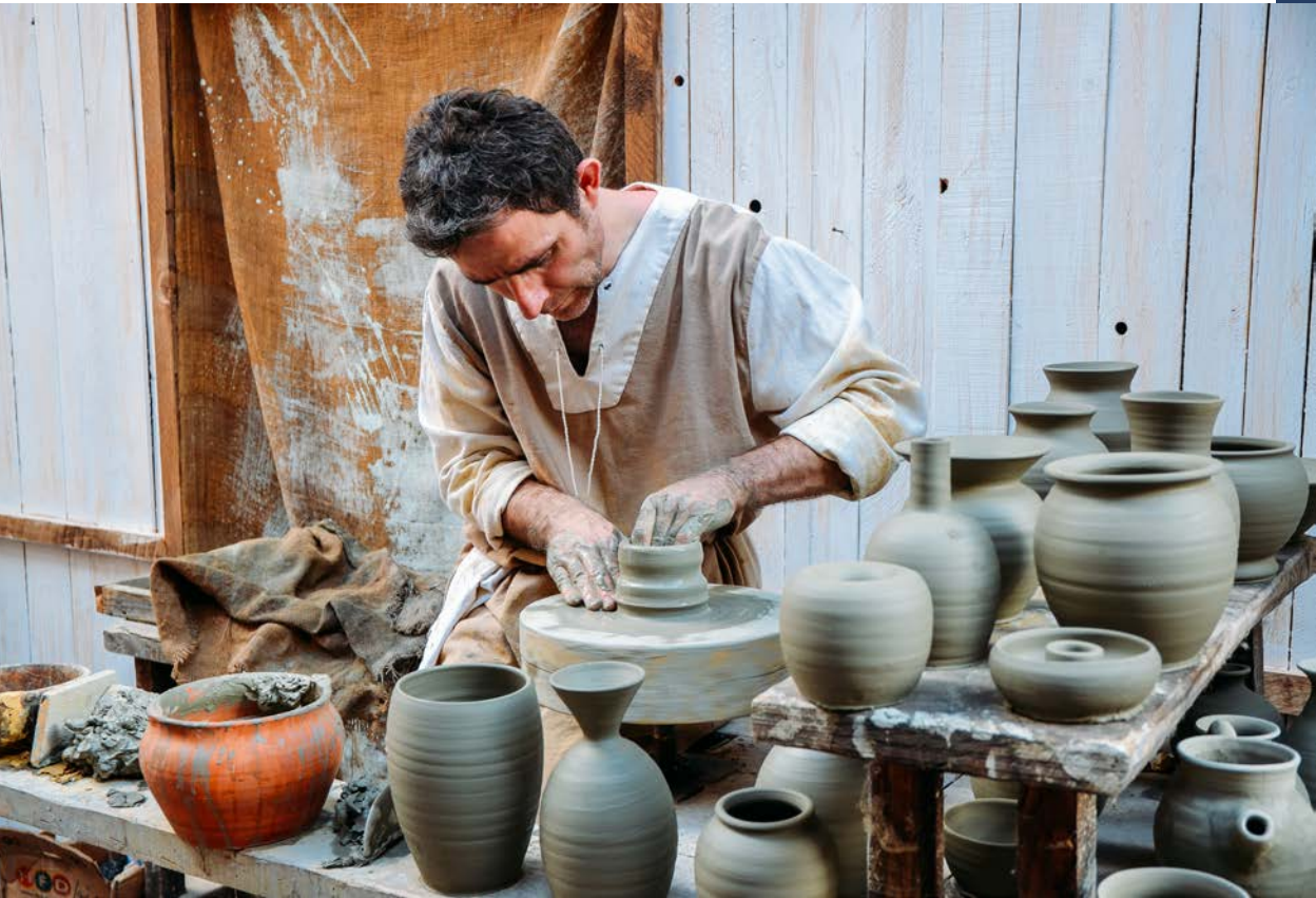
Bevagna, Italija, foto: OlgaMerolla / Shutterstock.com